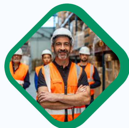
JEFES DE LOGISTICA