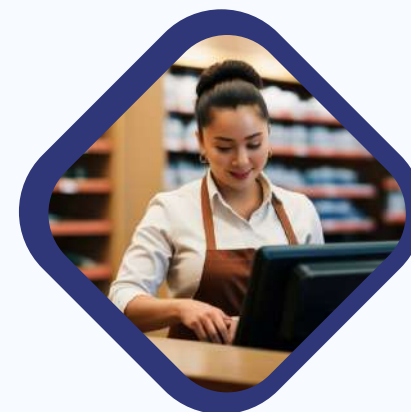
JEFES DE COMPRAS RETAIL Y CADENAS COMERCILES