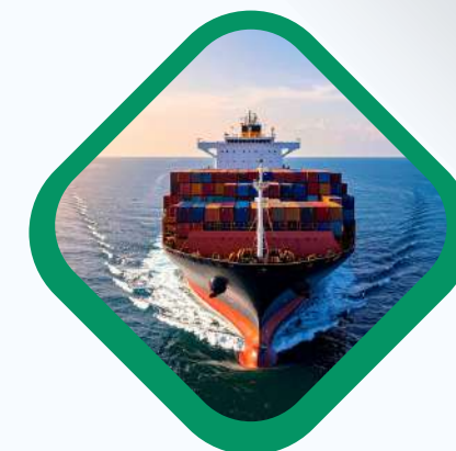
RESPONSABLES DE IMPORTACIONES