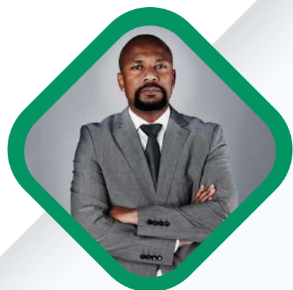
DUEÑOS Y GERENTES DE EMPRESAS IMPORTADORAS

El visitante de EXPO ASIA LATAM es un tomador de decisión o influyente directo en procesos de compra internacional, que asiste con un objetivo claro: identificar proveedores confiables, evaluar nuevos productos, cerrar acuerdos comerciales y explorar oportunidades de expansión de negocio.