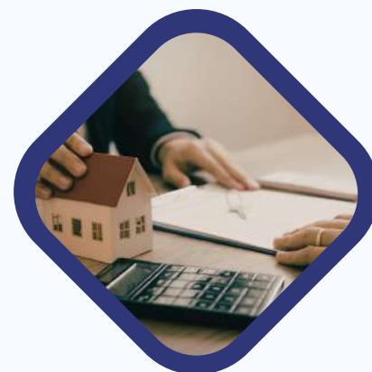
JEFES DE COMPRAS